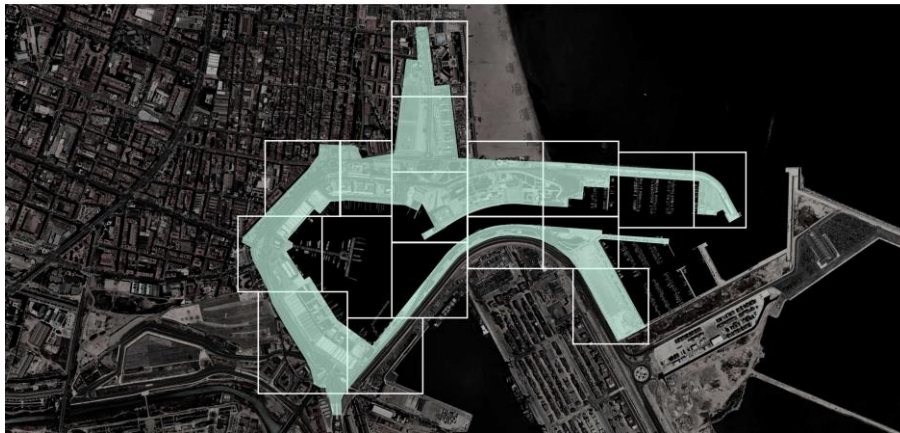
Rysunek 2. Zakres projektu. Oprac. Andres Ros Campos

Każdy student w grupie u prowadzącego wybiera swój fragment portu do rozwiązania zabudowy z budynkiem wielorodzinnym. Jednak cała grupa pracuje nad opracowaniem projektu urbanistycznego portu jachtowego, w którym znajdą się poszczególne projekty budowli studentów. Zadaniem całej grupy jest opracowanie jednej planszy ideowej całego portu w uzgodnionej z prowadzącym grupę skali, który będzie odpowiedzią na problemy tego miejsca. Najbliższe otoczenie indywidualnego budynku jest rozwiązywane przez jednego studenta, jednak cały obszar musi być ze sobą skoordynowany przez wszystkich studentów w jednej grupie.